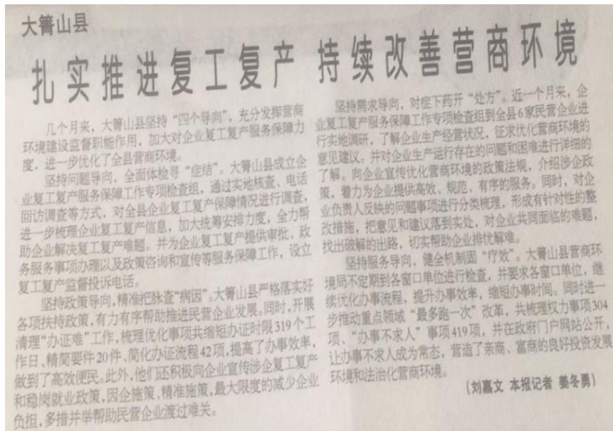
图2 伊春日报“涉企信息”公开